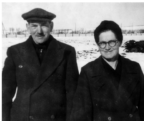
Parret midt i en travl hverdag.