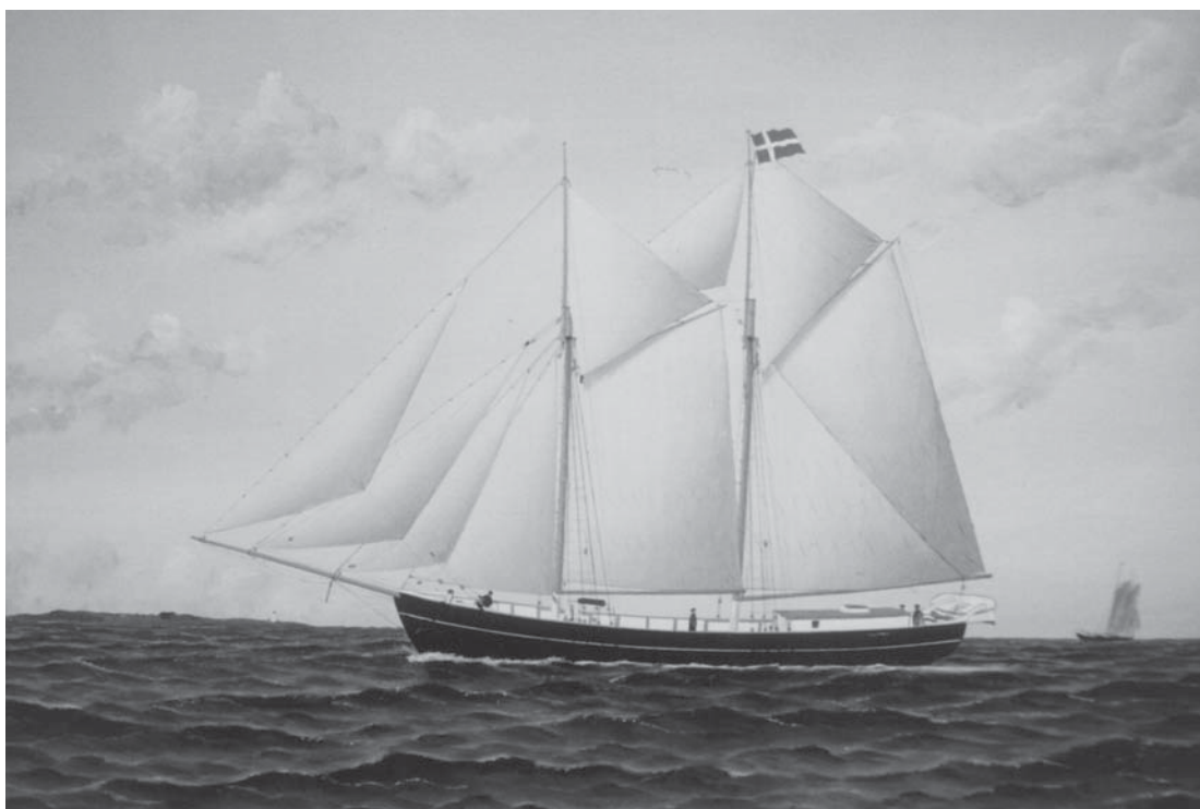
Bengtssons portræt af N.C. Wejsbjergs skonnert »Capella« – nu i Struer Museum. Et andet af Wejsbjergs skibe var »De tolv søskende«, opkaldt efter skipperens egen familie, der stammede fra Venø, hvor slægtsnavnet blev hentet. Tidligt flyttede familien dog til Jegindø, hvorfra alle 11 sønner kom ud som søfolk i hele limfjordsområdet, hvor de opererede fra havnebyer som Lemvig, Oddesund, Thisted, Aalborg og Struer.

»Hedvig« var bygget 1863 i Sønderborg i Danmark som jagt »Metha«, men blev i 1883