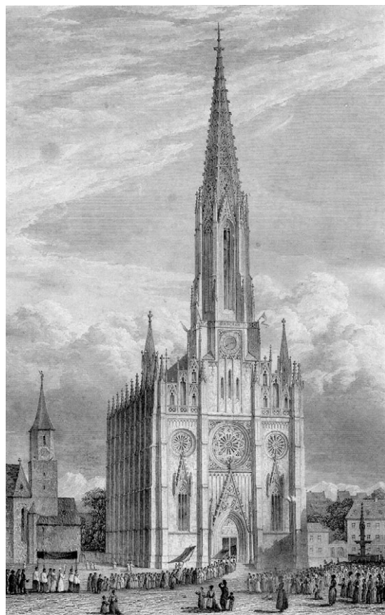
Die neue Pfarrkirche der Vorestadt au in München. Den gotiske kirke i bydelen Au var en stor turistattraktion. Nyopført 1831-39. Nybyggede kirker var en sjældenhed i Kolds ungdom, og denne her er endda stor som en katedral.

München var med godt 100.000 indbyggere knap så stor som København. Datidens rejsende blev der længe, for der var meget at se. En samtidig geografi oplyser: »Münchens... Befolkning udmærker sig ved en høj Grad af Forlystelsessyge og Sædeligheden synes at dømmes efter Forholdet mellem ægte og uægte Fødsler, at staae temmelig lavt.« 64