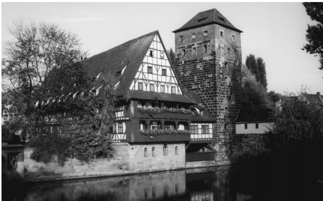
Foto af Der Henkersteek 2001.

En fristende tanke, men meget vanskelig - og enkelte steder helt umulig - at gennemføre. Det gælder de strækninger, hvor motorvejene er lagt oven på de gamle landeveje, der må man jo ikke gå! Stort set er der imidlertid stadig gamle landeveje der, hvor postvejene gik i