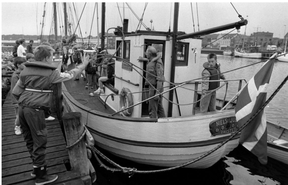
Fortøjningerne kastes – og »Niels Juel« stævner ud på sin længste tur – deltagelsen i KFUM-spejdernes landslejr i Holbæk i 1990. Skipper holder øje med det forreste »spring«.

spidsen, men de så sig ikke længere i stand til at klare arbejdet med vedligehold og i det hele taget at få båden i vandet, da man havde fået en del familiemæssige forpligtelser. Efter en del forhandlinger faldt alt på plads, og lørdag den 21. december 1991 kunne båden køres til Thisted på blokvogn.