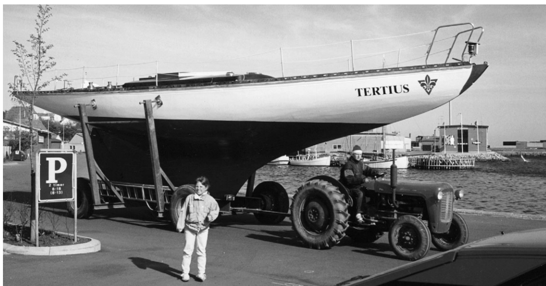
Efter den store reparation er »Tertius« klar til at blive søsat.