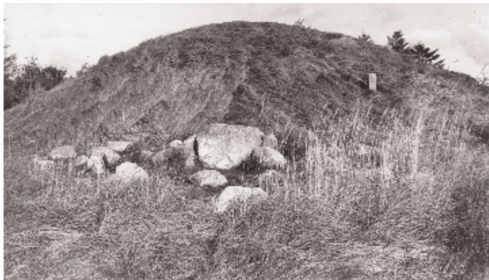
Stævenshøj, den største af højene på herredsskellet. Den er nok en tinghøj, hvad navnet kunne tyde på.

Over heden har der sikkert alle dage været færdsel under afvikling af samkvemet mellem Hassing og Refs. Sporene heraf findes endnu visse steder i bunden af de beplantede arealer, hvor de gamle, dybe hjulspor har fået lov at bestå, da man plantede arealerne til med skov. Disse stærkt opkørte hjulspor findes eller fandtes også på det til sidst i fyrreerne ubeplantede hedeareal umiddelbart nord for Grurup-Astrupvejen. Masser af spor side om side, men alle rettet ind i linien landsbyen Hassing Vestervig kirke. Denne samfærdsel ad disse kørespor må vel være forladt omkring ved anlæg af den endelige amtsvej i 1870'erne og jernbanen i begyndelsen af 1880'erne. Køresporene i lyngen side om side, som altså til en vis grad her er bevaret for eftertiden, er et produkt af ikke anlagte eller befæstede vejanlæg. Man kørte bare