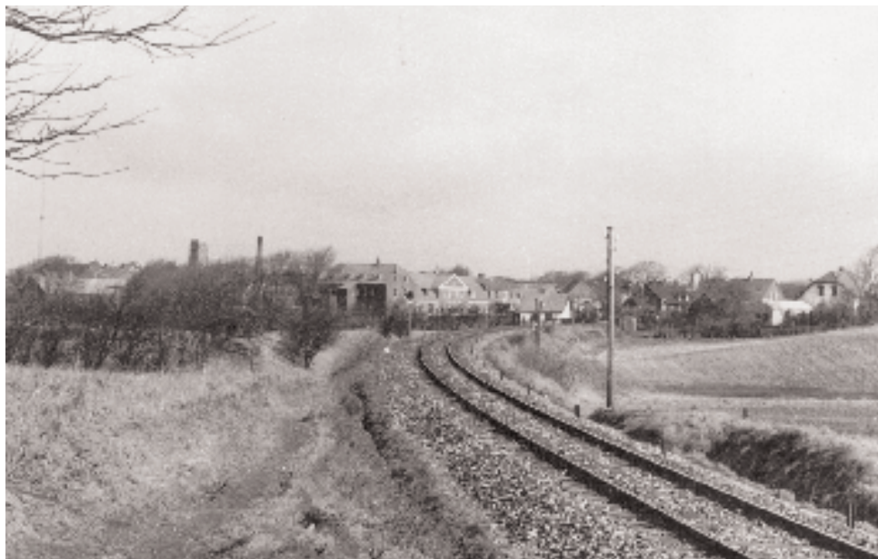
Jernbanen Struer-Thisted buer sig sydfra indtil stationsbyen Bedsted. I midten over »Æ tip« (et jorddepot fra anlægsfasen) ses Bedsted kro.

gæster, for det fremgår af forskellige arkiver, at der bl. a. blev holdt en del møder og stiftende generalforsamlinger med henblik på etableringer i forbindelse med handel og andet erhverv i byen. Således blev der umiddelbar nord for den nye kro i 1896 bygget en brugsforening, som blev fornyet med en større ejendom lidt længere op ad den nuværende Thylandsgade. Men da havde man allerede i 13 år haft købmand på pladsen. For umiddelbart over for stationsbygningen opførte købmanden i Gl. Bedsted i 1883 den aflange bygning med forretningslokaler mod øst og beboelse i vest, som bestod til sidst i 60'erne med købmand Chr. Skaarup som den indehaver, der var længst bag disken. Butikken og dens indretning husker jeg som meget anvendelig til at komme på museum.