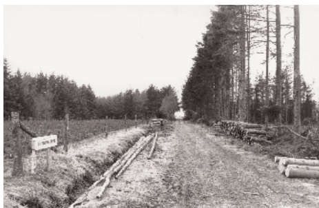
Et stykke af Tingvejen i Rønhede plantage.