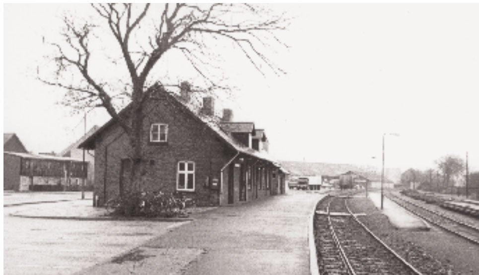
Stationsbygningen i Bedsted set mod øst. I forgrunden til venstre lå tidligere en toiletbygning.

Den kromand var iøvrigt en forudseende mand. Da han i 1882 erhvervede jord til sin krobygning, må han have kunnet se,