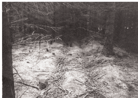
De gamle hjulspor ses visse steder tydeligt endnu.

Hvis vi igen ser på det gamle matrikelkort fra 1844 med de påførte matrikelnumre med bogstav fortløbende fra tre og til et sted i tyverne, ja, så ser vi faktisk på en liste over en del af det fæstegods, der til først i 1800-tallet hørte under godset Tandrup i det nordøstlige hjørne af Bedsted sogn, nemlig Mølgårde, Brogårde, Grøntoft, Habæk, Statshove, Bjerregårdene, Ullits m. fl. Rønhede-arealeet nord for herredsgrensen er udlagt til lyngslæt og måske tørvegravning for disse fæstegårde og her på kortet markeret med tilsvarende