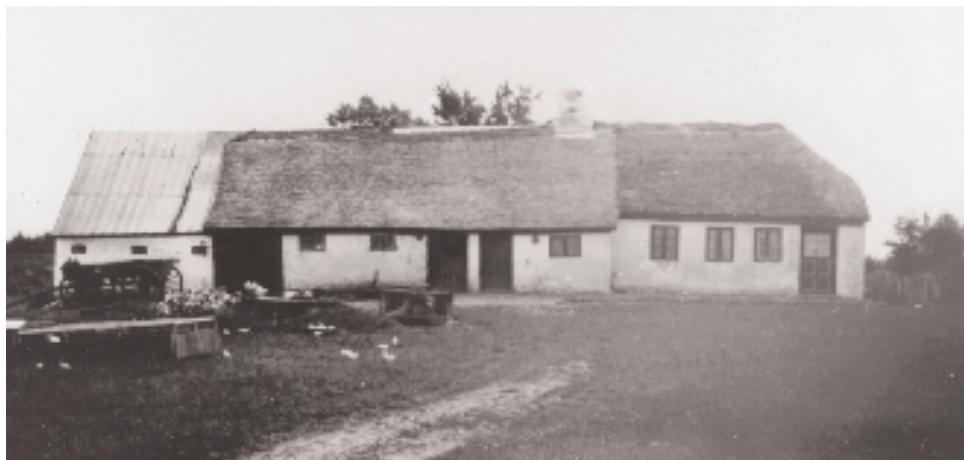
Vestervigvej nr. 28. Billede fra ca. 1945.

Folkene omkring disse handelsstationer var vel egentlig ikke særlig glade for det