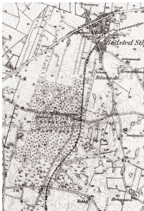
Sammenlign de 2 kortudsnit. Henholdsvis matrikelkortet fra ca. 1860 til venstre (Plantagen og markering af jernbanen indtegnet) og til højre Geodætisk Instituts målebordsblad fra 1942.

hvert fald ikke på den tid noget tegn på beboelse. Ja, end ikke på området, hvor stationsbyen senere skød op, ses det mindste tilløb til »civilisation«. Hele arealet er altså i midten af forrige århundrede stadig en slags forsyningsområde for egnens bønder med hensyn til lyngslæt og tørvegrøft, som det jo kan læses i mange gamle skøder der fra egnen. Man vil endvidere på det omtalte matrikelkort bemærke en markant forskel på parcelleringen i henholdsvis Vestervig og Bedsted sogne. I Vestervig ses store, nærmest kvadratiske blokke med få ejere, hvorimod man i Bedsted sogn har inddelt i lange og nærmest påfaldende smalle lodder og mange ejere.