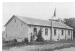
Klim Søndre Forsamlingshus. Rejst 1877, nedbrudt 1965. I stedet blev opført gymnastik- og mødesal ved Klim friskole 1965. I baggrunden tårn og spir på frimenighedskirken.

Huset kom i de følgende 90 år - indtil 1965 - til at danne ramme om mange gode aktiviteter for børn og forældre, for skytteforeningens medlemmer, gymnaster, folkelige møder, og her tænkes især på de såkaldte efterårsmøder, der samlede mange deltagere fra både nær og fjern.