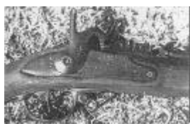
Det var denne type, der i den første tid blev brugt i Klim Skytteforening.