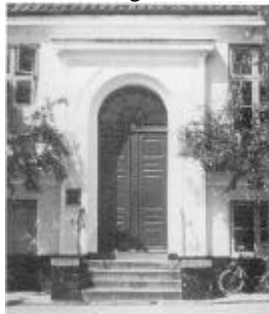
En usædvanlig gadedør.

Et lille gulkalket vaskehus i haven passer til huset som et tyende til sit herskab og vidner om tidligere tiders mere omstændelige husholdning.