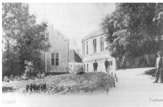
Facaden med de "brukkede" hjørner bøjer sig elegant for adgangen til plantagen.