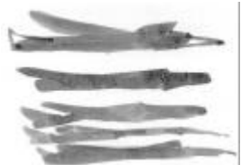
De mørke fugle fløj ved gry med motorstøj

Én for indgangen til krigen, og her blev det Otto Gelstedts "De mørke fugle fløj", som han ovenikøbet skrev den 9. april 1940. Jeg bruger de to første linier.