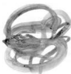
Man binder os på mund og hånd men man kan ikke binde ånd

Så kom sangen af Poul Henningsen, som er skrevet til en revy, og som er et eksempel (måske det bedste) på, hvordan man forsøgte at sige noget til hinanden, uden at tyskerne direkte kunne falde over det og sætte deres censur ind. Herudover får han i netop to linier repeteret den sandhed, at ånd ikke kan bindes, det vel nok skarpeste bud til et menneske, for så er der ingen undskyldning.