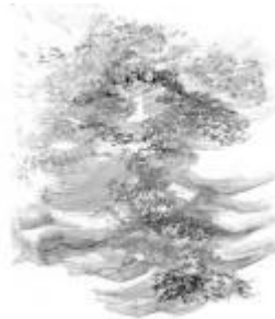
En lærke lettet, og tusind fulgte, og straks var luften et væld af sang