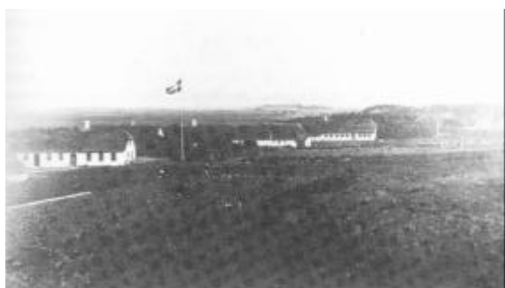
Fotografiet fra 1908 viser, hvorledes den gamle hovedgård Vesløsgård lå hævet over sin landsby Vesløs. Billedet viser den karakteristiske bebyggelse med lange højremhuse, der havde stald i den ene ende og beboelse i den anden. Vejlandsbyen Vesløs strækker sig som en randbebyggelse på kanten af engene ved Vesløs Vejle. Hovedgården blev solgt til Hanherreds Udstykningsforening, som i 1910-11, lod den udparcellere, og bygningerne blev revet ned. På stedet opstod en del af Vesløs stationsby.