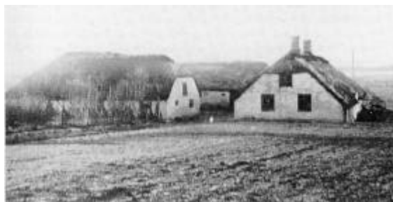
Ejendommen matr. nr. 3 a i Veslås, som lå neden for skolen, var en fæstegård under Vesløsgård. Den opførtes som parallelgård i 1788; 1878 tilføjedes de to sidefløje til udlængen, og stuehuset blev forsynet med trægulv. Bygningerne er nu for længst revet ned.

Ved overtagelse af fæstegården måtte bonden sædvanligvis præstere en kontant ydelse, indfæstning, der i princippet stod i forhold til gårdens værdi, beliggenhed og tilstand. Beløbene svingede fra under 10 rigsdaler til 100 rigsdaler for de største og bedste gårde. Til sammenligning kan anføres, at en god hest som regel vurderes til omkring 14 rigsdaler. I tilfælde af overtagelse af en forsiddergård (dvs. en gård, som fæsteren havde måttet afstå på grund af armod, druk, efterladenhed eller lignende) kunne beløbet helt bortfalde. Ofte betaltes da i stedet forgængerens restance, hvis da ikke gården var i så ringe stand, at fæsteren blev fri for både restance og indfæstning og endda måtte have hjælp til såsæd, trækraft og materialer til reparation af bygningerne, foruden fritagelse for hoveri, mens gården blev genopbygget. Mens det således ikke var særlig kapitalkrævende at få foden under eget bord, måtte fæsteren årligt betale afgift, landgilde, til godsejeren i form af naturalier eller penge. Endvidere var han pligtig at gøre hoveri på hovedgården eller betale et kontant beløb, arbejdspenge. Fæstebrevene angav ikke, hvori arbejdet bestod, eller hvor meget hoveri, bonden skulle yde. Indtil ca. 1750 (for nogles vedkommende før) blev blot angivet, at bonden skulle ”gøre sædvanligt arbejde” eller lignende. Siden blev hoveriet angivet som en plovdæl (se forklaring senere).