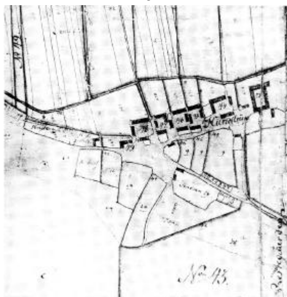
Hunstrup by 1803. Udsnit af originalkort i Museet for Thy og Vester Hanherred. Mus. nr. 2247X6.

Ovennævnte eksempler og oplysninger er hentet fra de hoverireglementer, godsejerne fra 1769 til slutningen af århundredet blev påbudt af indsende i forbindelse med reformtidens forsøg på at få hoveriet fastlagt til bestemte slags arbejder og bestemte antal arbejdsdage, for at sikre bonden mod et stadigt stigende hoveri. Før denne tid havde man ikke haft faste reglementer.