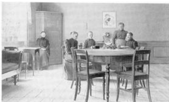
Interiør fra Asylet i Risskov.

I Det kongelige Sundhedskollegiums forhandlinger i året 1878 anføres det, at Sundhedskollegiet den 5. april 1878 afgav følgende erklæring: