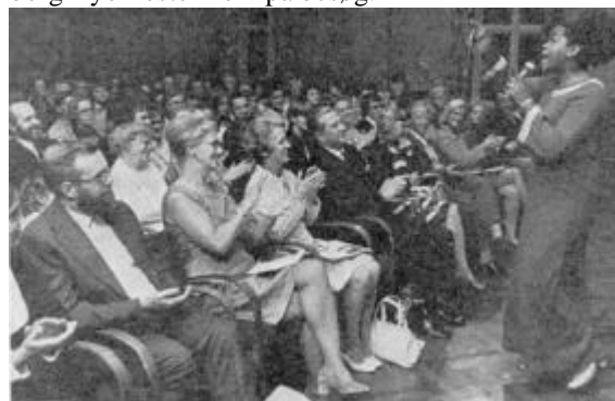
En aften i Thisted Musikforening. Sangerinde fra "Stars of Faith" begejstrer publikum 12. september 1973.