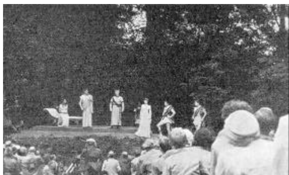
Shakespeare: En skærsommernatsdrøm, opført 15. juli 1957 på Thisted Friluftsteater.