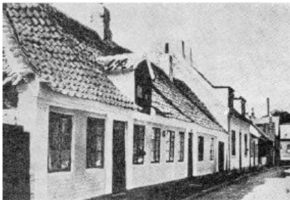
Kolds hjem, Strømgade 12, Thisted, set fra øst.

stedmoderen skulle bo hos ham), således at den beboede del af huset blev 20 alen langt og 7\frac{3}{4} alen bred 5 ). I 1820, da børnene var begyndt at komme, udvidede han igen beboelsen, ganske vist kun med 1\frac{1}{2} alen, men grunden var ikke mere end lige stor nok til det. 2\frac{1}{2} alen var da også en ganske pæn længde for et beboelseshus i de tider. Værdien blev da ansat til 800 rdl.