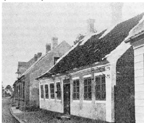
"Skaarups hus", Nørregade 24, Thisted, med klejnsmedeskilt (en nøgle).