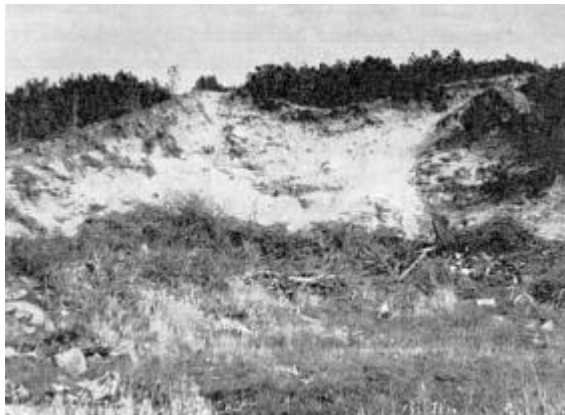
Trab sande, set fra vest

der i nærheden må Trab have ligget, med Skurup som nabo mod syd eller sydvest. Overgård havde ligesom Trab ifølge markbogen agre ved søen, men da bygningerne var øde 1683, har den sikkert ligget længere mod vest, således at den blev ramt af sandflugten før Trab og Skurup . Inte var næsten øde 1683, og dens plads må sikkert også søges noget vest for søen. En klit derude kaldes på kortet fra ca. 1790 Zidsel Intes bakke .