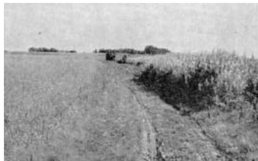
Den gamle landevej i skellet mellem Skjoldborg og Kallerup. Set fra nord.

Denne vej fra Vilsund til Sjørrind har da trukket færdselen fra og til Oddesund til sig. Det kan her have haft betydning, at Sundby var gammel kongelig ejendom. Ifølge Valdemar Sejrs jordebog havde " Sundby og Sundby å " en værdi af otte mark guld. Denne by hørte da til Hundborg herred, hvad den egentlig gør endnu, skønt den ligger i Stagstrup sogn, som ellers hører til Hassing herred (se Trap: Danmark ). Denne mærkelighed tyder endnu på, at Sundby har haft en eller anden særlig betydning.