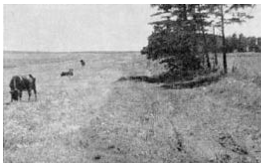
Alvejen mellem Næstrup vad og Halvvej høj. Set fra nordøst.

I ældre tid var landet ikke delt i amter eller len, men i sysler, der antages at være fremstået af de gamle småriger (tjod), hvoraf Danmark er samlet. Deres retslige midtpunkt var sysseltingene eller bygdetingene, som endnu nogle steder bestod i middelalderen, men som for Jyllands vedkommende efterhånden afløstes af landstinget i Viborg. På sysseltingene blev også kongerne hyldet, således endnu Christoffer den Første.