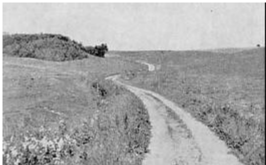
Ved Næstrup vad. Set fra syd

Ved Næstrup vad ligger en del af omgivelserne endnu hen som i gamle dage, og man ser tydeligt gamle vejspor, der fra vest fører mod vadestedet. Her var der en bro over vandløbet, som kommer fra Præstkjær østen for Sjørrind og løber vest og syd for Næstrup forbi Nordentoft, hvor der engang var en vandmølle, ud i den dybe dal mellem Ås og Skjoldborg.